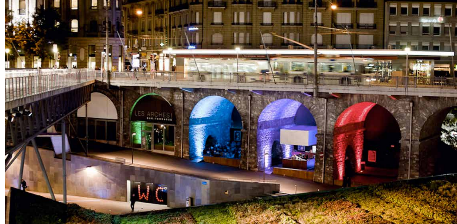
Les Arches ! - Bar terrasse, sous le Grand Pont à Lausanne. Projet en collaboration avec le bureau architecture « SAS ».