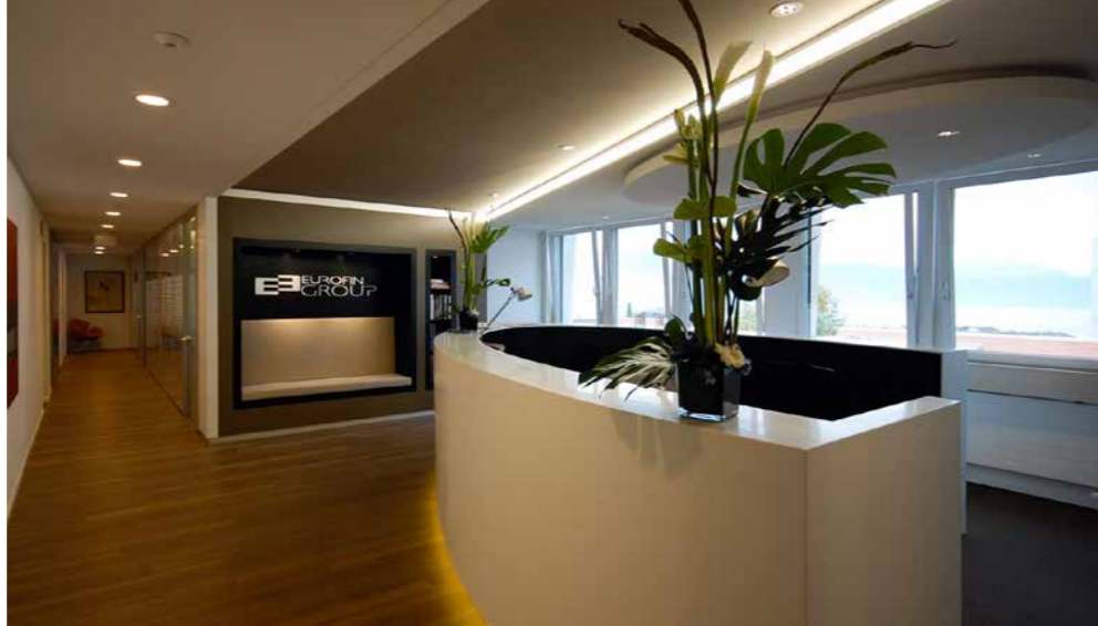
Hall d'entrée d'Eurofin Group, Lausanne.